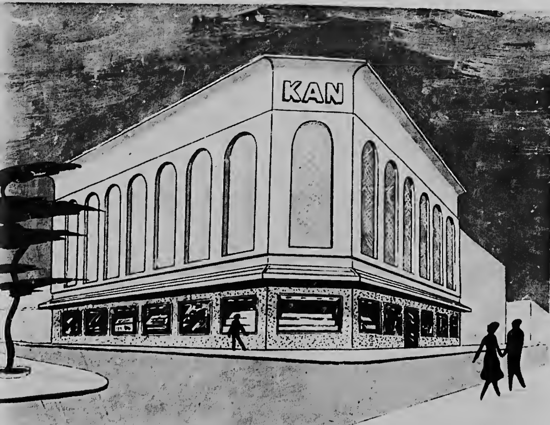
aki ta muestra e edificio di joyeria "Kan" manera cu e lo bai bira den futuro. E edificio aki ta den Nassaustraat na Oranjestad.

ORANJESTAD - Ayera, joyeria "Kan N.V." a habri un filiaal den Frontstreet na Philips-Sint Maarten. Cu e filiaal di joyeria Kan ta worde instalada na tur e islanan di Sint Maarten y tambe di e islanan cu ta bishita e isla. E filiaal aki ta colaborando energeticamente cu e desaroyo economico di e islanan Neerlandes. E edificio completamente nobo ta moderno y masha buche, di manera cu e ta un gozo di bishita e filiaal na Sint Maarten y tambe di e islanan cu ta bishita e isla. E filiaal aki ta colaborando energeticamente cu e desaroyo economico di e islanan Neerlandes. E edificio completamente nobo ta moderno y masha buche, di manera cu e ta un gozo di bishita e filiaal na Sint Maarten y tambe di e islanan cu ta bishita e isla.